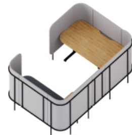
LPE SN3 + LP HR