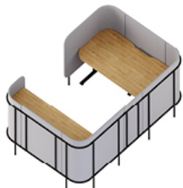
LPE MN1 + LP HR