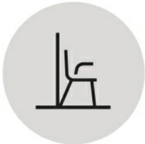
das Produkt berührt nicht die Wände