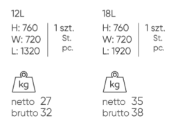
SNR TB 12L/18L

Die Maße sind in Millimeter angegeben und betreffen Produkte in Basisausführung. Die tatsächlichen Maße können von den angegebenen abweichen und sind von den ausgewählten Optionen abhängig. Bejot behält sich das Recht vor, die ausgewählten Bestandteile des Produkts zu ändern, was die Maße geringfügig beeinflussen kann. Im Falle genauer Anforderungen an die Abmessungen des Produkts bitte wir um Kontaktaufnahme, um die Maße zu bestätigen. Die Spezifikation bildet kein Angebot im Sinne des Zivilgesetzbuches. Abmessungen und Gewichte sind ungefähr und können um 5% variieren. Die Anforderungen der Norm werden immer erfüllt.