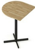
TB CSC 80H