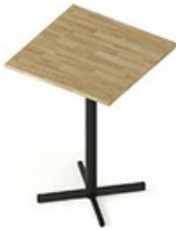
TB CS 80H