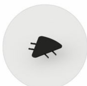
LE LC TB 45