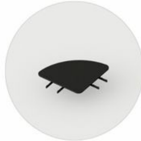
LE LC TB 90