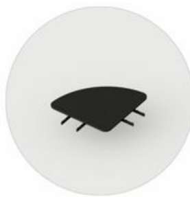
LE LC TB 90