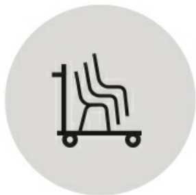
sztaplowanie na wózku